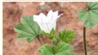
Skär kattost.

RE – Försvunnen CR – Akut hotad EN – Starkt hotad VU – Sårbar NT – Missgynnad DD – Kunskapsbrist